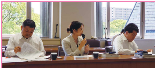
6/7 予算勉強会がありました