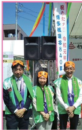
5/3 県議としての初仕事は博多どんたくでの西新演舞場の開会セレモニー