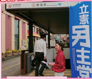
朝の店頭も継続しています