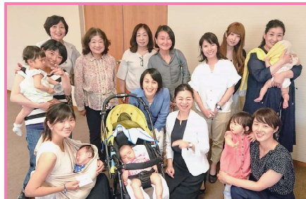
6/25 一般質問にたくさんの方が応援に来てくれました