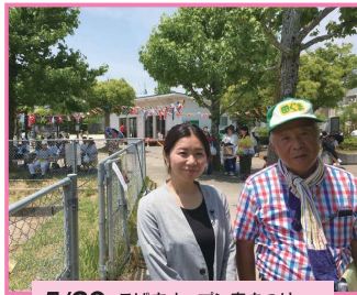
5/26 こばすオープン春まつり(田隈中公園)