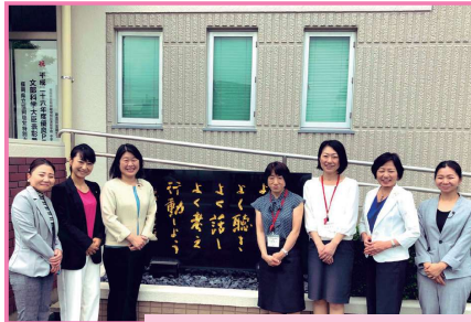
6/4 荒江の福岡県立福岡聴覚支援学校で医療児ケアの現状と課題についてお伺いしました