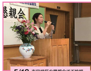
5/12 有田校区の懇親会でご挨拶させていただきました