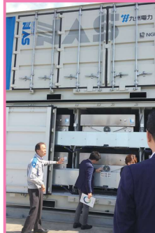
5/30 会派での行政視察(写真は豊前市の九州電力蓄電池変電所)