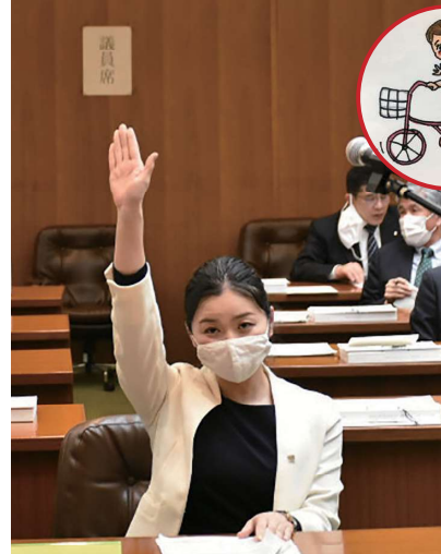
▲予算特別委員会にて。ポニーテールをして、校則でなぜポニーテールはダメなのか、県教育委員会に聞きました。

他に、福岡県は昨年9月に、国の宇宙ビジネス推進自治体に選定されました。来年度予算でも大きく取り上げられていた宇宙ビジネスの振興についてもお伺いしました。