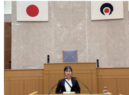
10/30 議会運営委員会で鹿児島県議会・宮崎県議会を視察し、議会のICT化について調査しました。