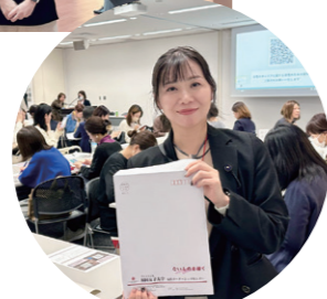
12/16 「福岡キャリアカフェ」大交流会に参加し、ロールモデルの女性の方々と意見交換しました。