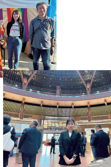
11/6 建築都市委員会を石川県・富山県を訪問。石川県立図書館などを視察しました。