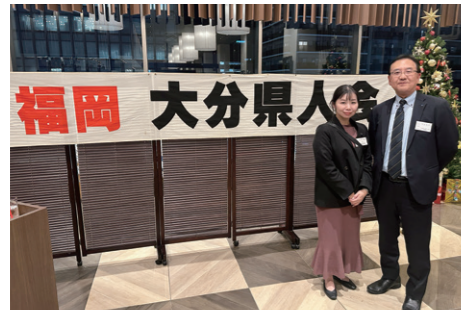
12/4 「福岡 大分県人会」に参加し、意見交換しました。