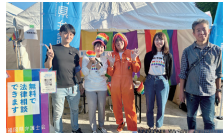
11/3 「九州レインボープライド2024」に参加しました。