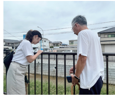
10/6 地域の方と金屑川について意見交換しました。