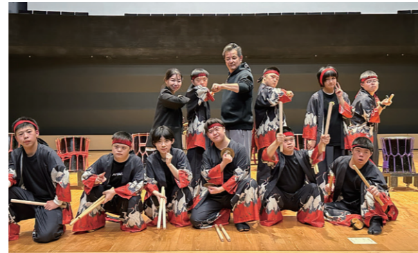
11/1 「障がい者と太鼓 兆(きざし)」の練習を見学し、ご要望を受けました。