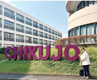
11/22 筑紫学園大学で「女性のライフキャリアと政治」について講演しました。