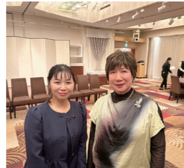
11/22 福岡県助産師会「母子保健活動に関する情報交換会」に参加し、現状と課題をお聞きしました。