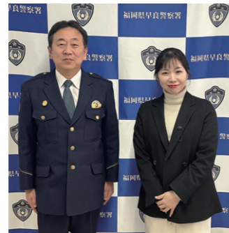
1/22 早良警察署にて桐原署長より、管内情勢について説明を受け、意見交換しました。