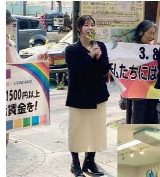
3/8 国際女性デーで、リレートークに参加し、アピールしました。