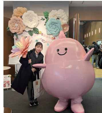
1/18 女性の健康課題を解決する「フェムテック」に関するイベントに参加しました。