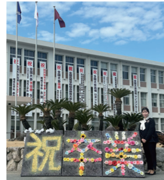
3/1 福岡県立福岡工業高校の卒業式に出席しました。