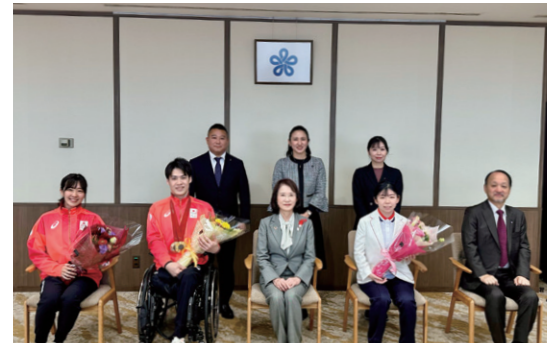
12/26 パリパラリンピック・バドミントン競技選手が副知事を表敬訪問されました。