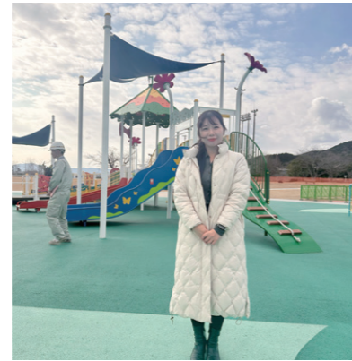
1/8 建築都市委員会で県営筑豊緑地のインクルーシブ遊具広場を視察しました。