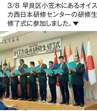
3/8 早良区小笠木にあるオイスカ西日本研修センターの研修生修了式に参加しました。▼