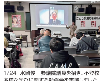
1/24 水岡俊一参議院議員を招き、不登校・多様な学びに関する勉強会を実施しました。