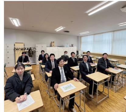
2/27 子育て支援・人財育成調査特別委員会にて札幌市立資生館小学校を視察しました。