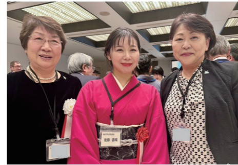
1/1 「早良区新春のつどい」が開催され、集まった地域の皆さまに地域課題などお伺いしました。