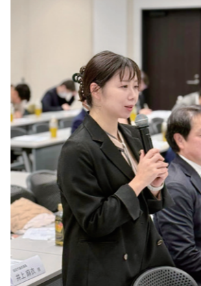
2/16 交通重点政策意見交換会に参加し、交通政策について学びました。